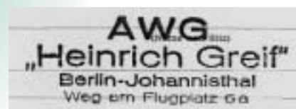
Stempel einer AWG, die Wohnungsbestände an die AWG »Freie Fahrt« abgab

Auch die Geschäftsstelle, nun in den Räumen der ehemaligen AWG EAW in der Eichbuschallee 23, musste neu organisiert werden, wozu die Benennung eines neuen Geschäftsführers und weiteren Personals gehörte.