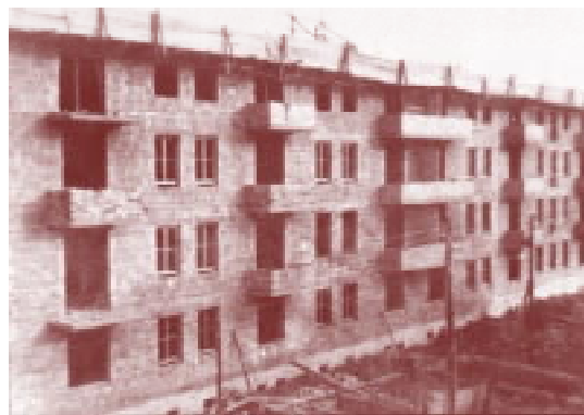
Die ersten Genossenschaftshäuser wurden in traditioneller Bauweise errichtet.