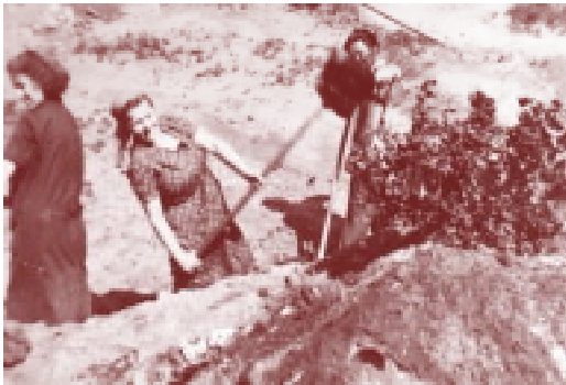
Mit Elan, Spaß und Tatkraft nahmen auch Frauen am Baugehen der Genossenschaften teil.