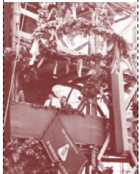
Richtfest am 9. September 1955 auf der AWG-Baustelle Am Treptower Park.