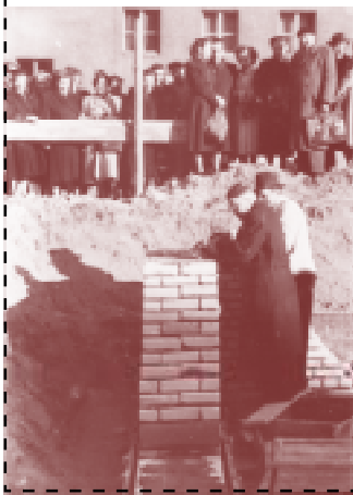
Zur Grundsteinlegung wurde eine Kasette mit Musterstatut, Mitgliederliste und Zeitungen vom Tage „vermauert“.

Aus der Betriebszeitung „Signal“ zur Grundsteinlegung der AWG des VEB Werk für Signal- und Sicherungstechnik Berlin-Treptow am 19. April 1955